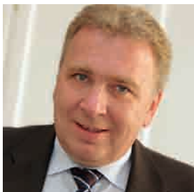
Dr. Jürgen Jaeschke Präsident des HLBS

Die Landwirtschaftliche Buchstelle ist eine historisch gewachsene und im Steuerberatungsgesetz bereits seit 1961 etablierte Bezeichnung für Steuerberater, die eine besondere Sachkunde bei der Betreuung von land- und forstwirtschaftlichen Mandaten nachgewiesen haben. Die Besonderheiten auf diesem Spezialgebiet des Steuerrechts rechtfertigen einen besonderen Regelungsrahmen innerhalb des Berufsrechts der steuerberatenden Berufe, den man in § 44 StBerG und den Ausführungsbestimmungen der §§ 42 bis 44 DVStB gesetzt hat. Der HLBS als Berufsverband der Landwirtschaftlichen Buchstellen nimmt die Aufgabe wahr, die berufsrechtlichen Voraussetzungen für den besonderen Sachkundenachweis in Zusammenarbeit mit den zuständigen Steuerberaterkammern auszufüllen, um eine hohe Qualität der Beratungsdienstleistungen auf dem Gebiet der Besteuerung der Land- und Forstwirtschaft zu gewährleisten.